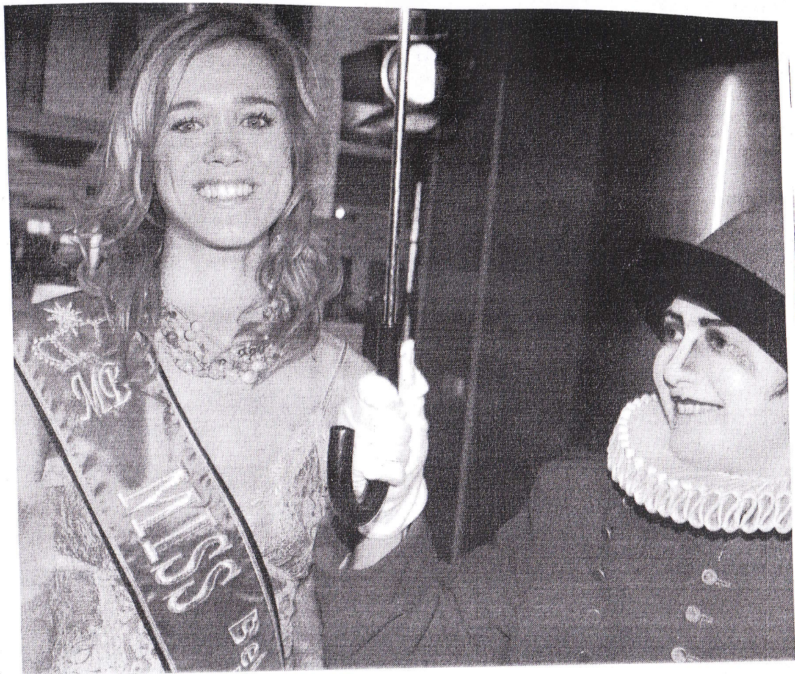
Le charmant sourire de Miss Belgique était indispensable à la fête. ■ L. LANGE

sonnes par jour (NDLR: toutes ne jouent pas...). Cela correspond plus ou moins à notre attente puisque nous tablons sur une moyenne quotidienne de 1.000 personnes d'ici fin 2006." Les pics de fréquentation se situent le jeudi soir, le vendredi soir et le week-end. Autre constat: les pensionnés sont plus nombreux l'après-midi, les jeunes le soir. Et les femmes préfèrent les machines à sous! Le casino, ouvert le 19 décembre dernier, a déjà rapporté à la Région bruxelloise 176.346€ en taxes sur les jeux et paris pour ses treize premiers jours d'exploitation. ■■