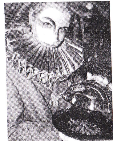
Un spectacle très coloré pour porter bonheur au casino. ■ LL