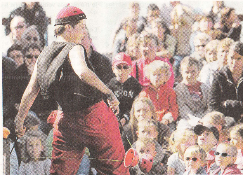
Etonnant spectacle de jonglage avec Hip Hop Circus.

Derniers spectacles, derniers applaudissements. Le 6 e festival des Sorties de bain se termine ce soir, à Granville, avec le Bal taquin sur des airs « tsigano-musette ».