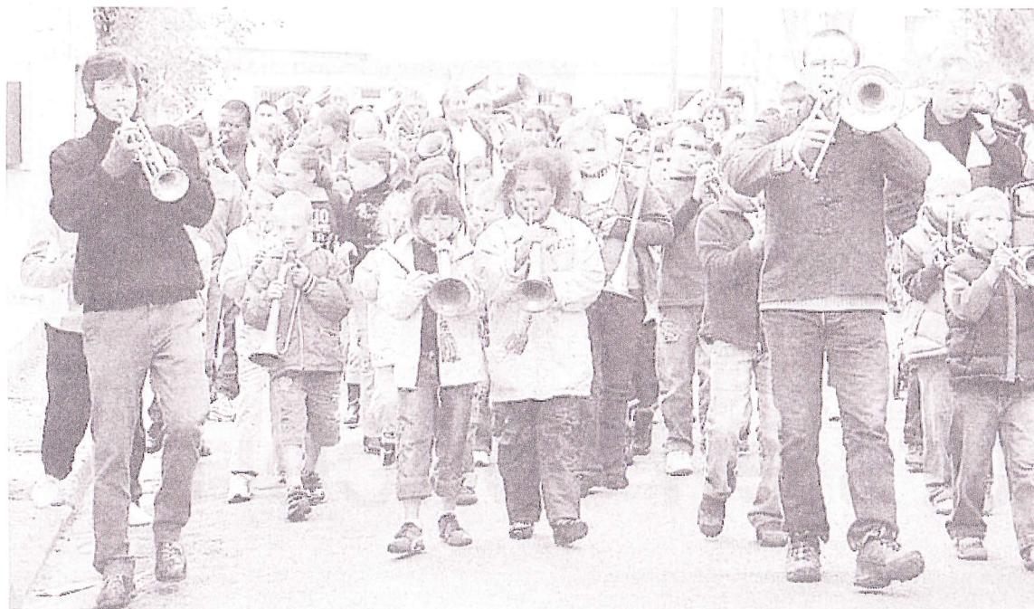
La fanfare de la Touffe et la compagnie Hip Hop Circus (à droite) sont deux des trente compagnies qui joueront ce dimanche dans les rues de Granville.